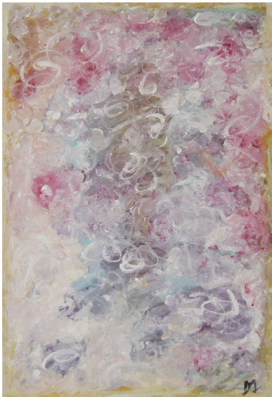
Pinocchio e la Fata Turchina