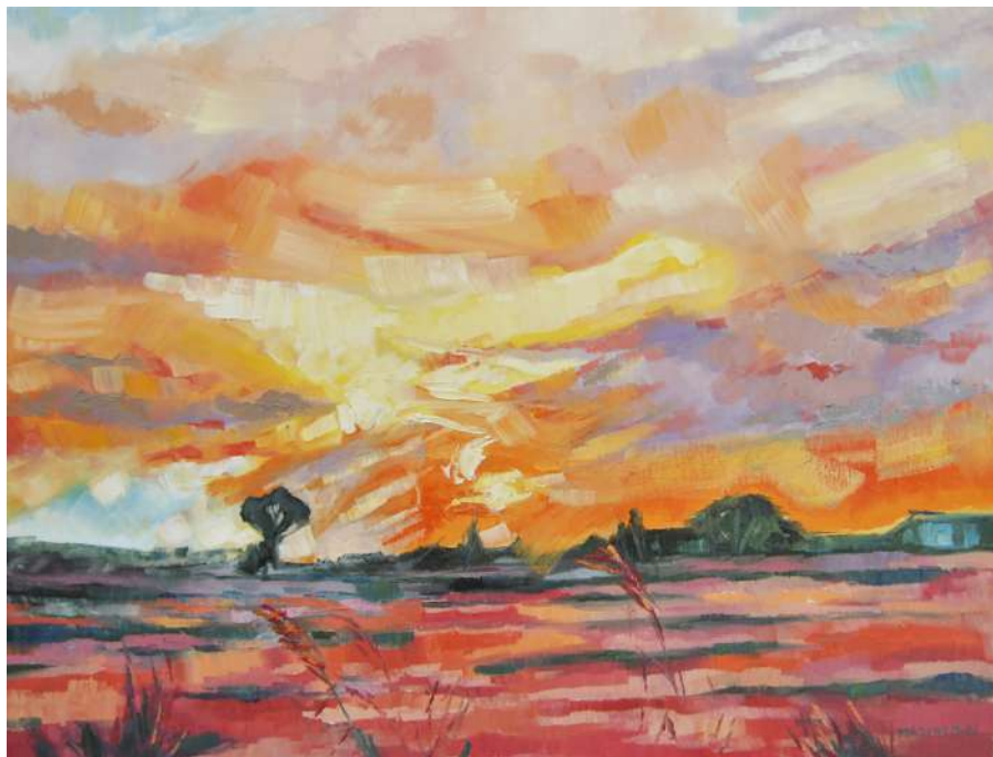
Tramonto al Puntone