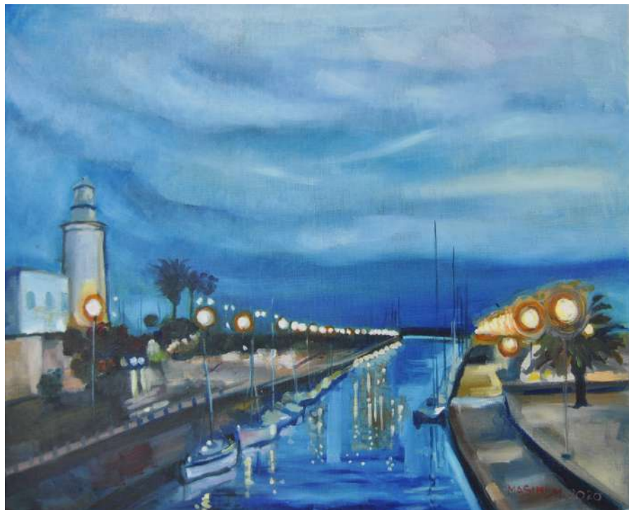
Il canale Burlamacco all'ora dell'aperitivo