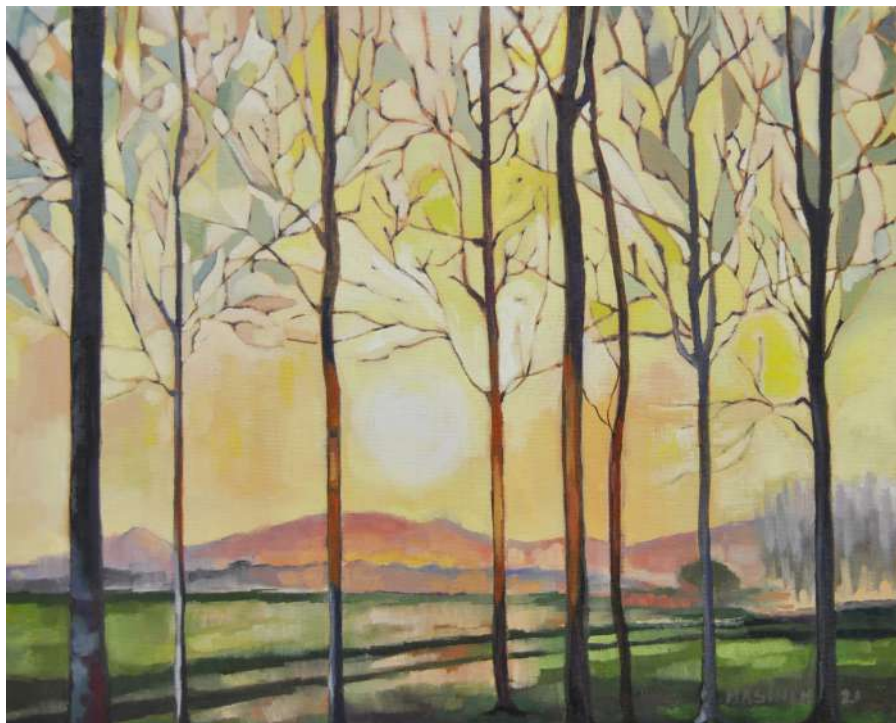
Tramonto in fungaia