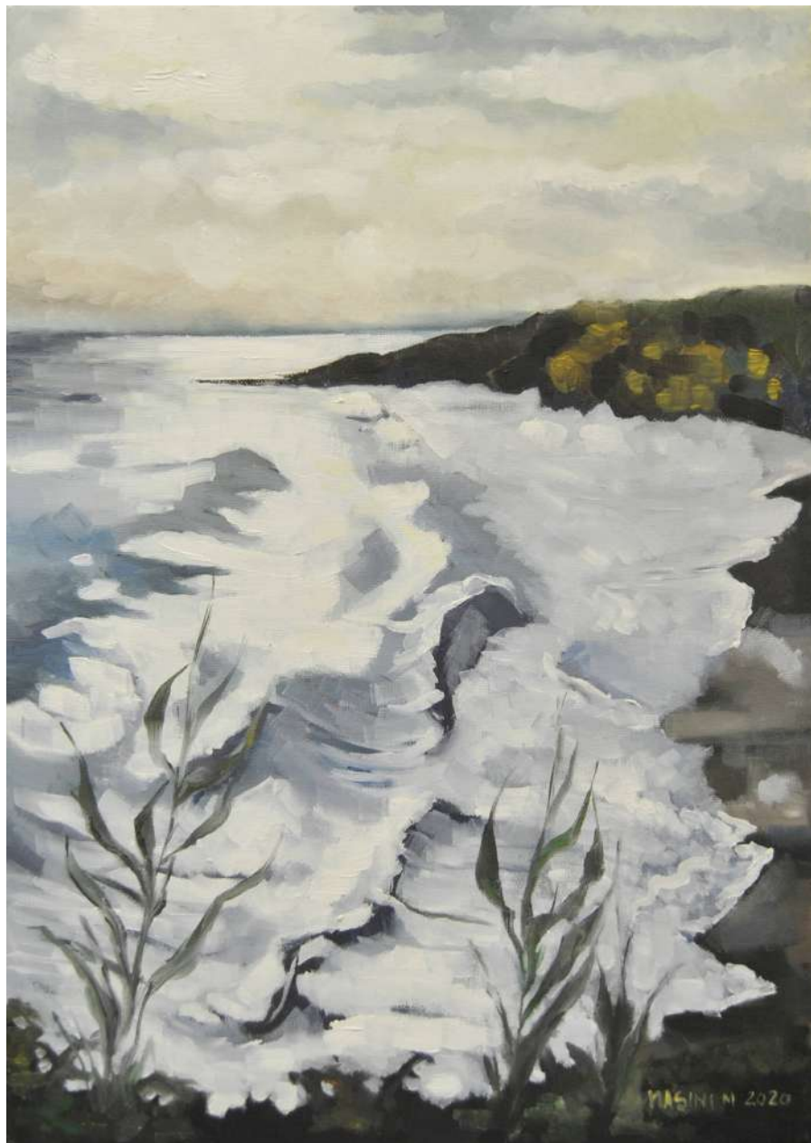
La scogliera di Svoronata