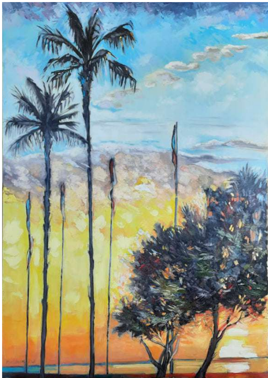
Palme e tamerici