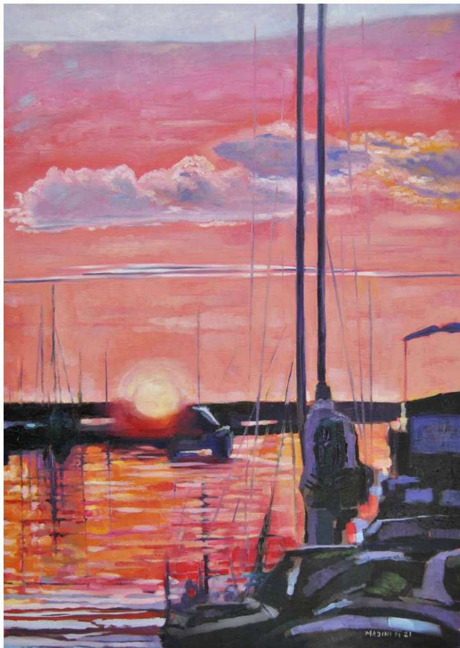
Tramonto al porto