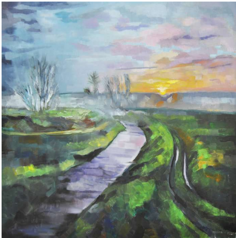
L'Alba di un nuovo giorno