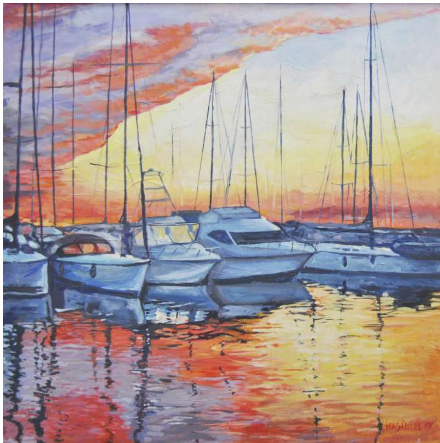
Il molo al tramonto -Viareggio