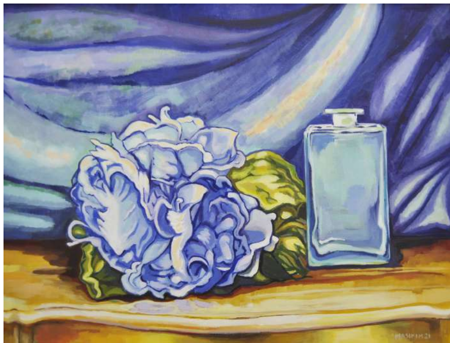
Natura morta con peonia