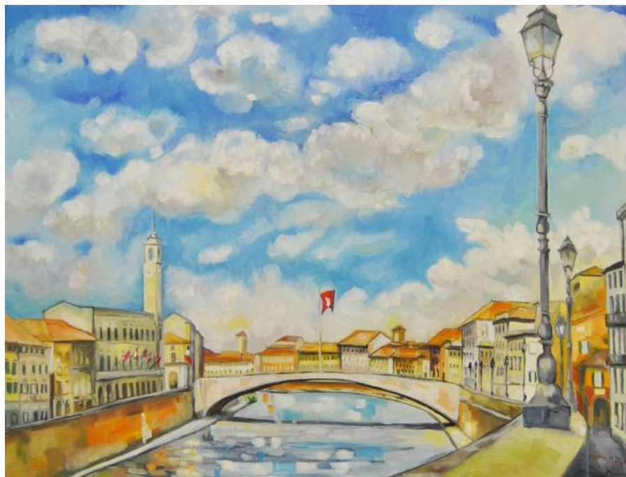
Pisa vista dal ponte di Mezzo e Lungarni