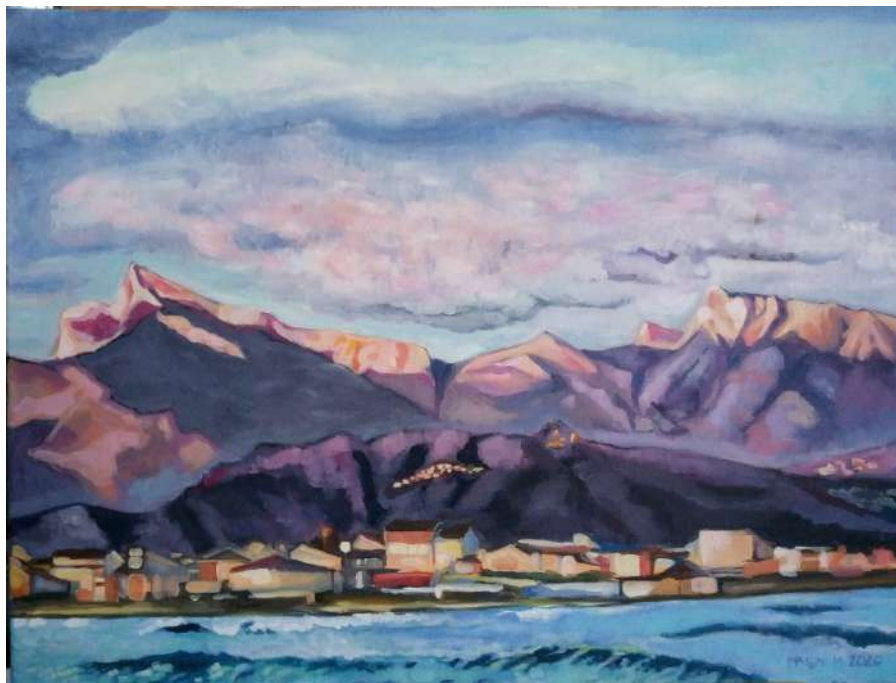
Veduta di Viareggio