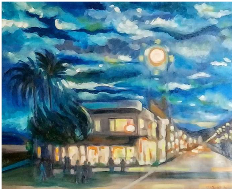
Viareggio in passeggiata