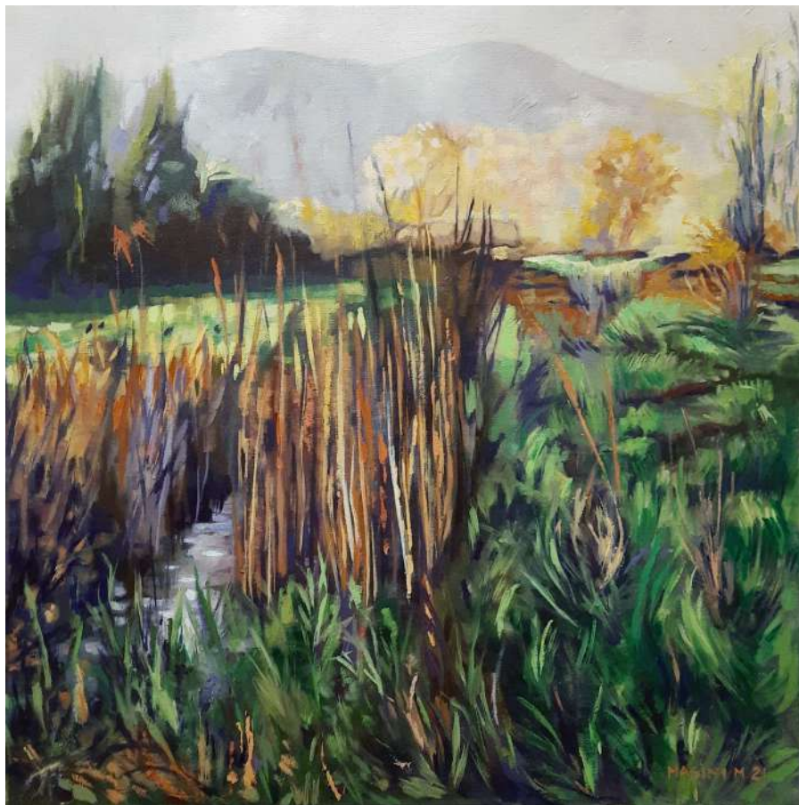
Nei pressi delle Cerbaie