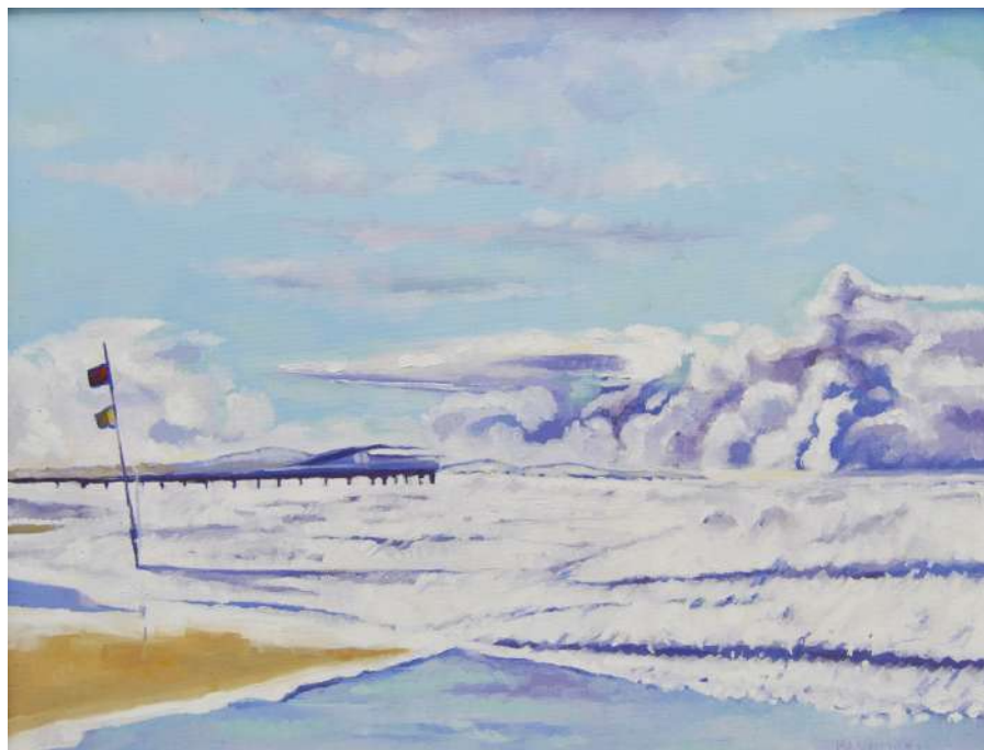
Libeccciata a Lido di Camaiore