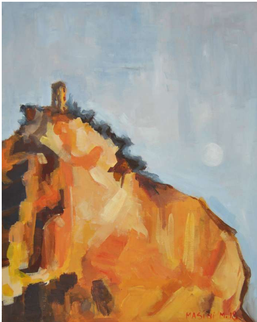
La torre di Caprona