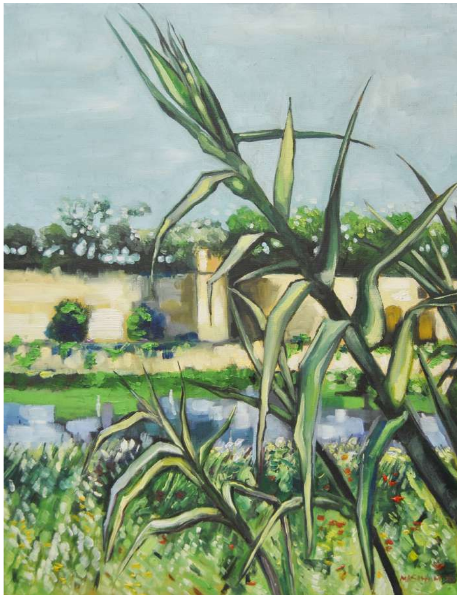
Le canne al Giardino Scotto