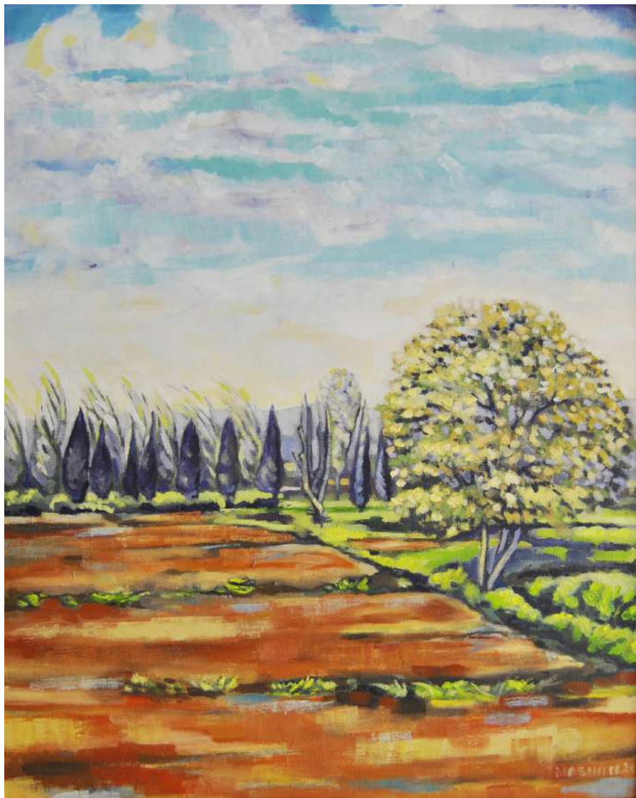
Guardando a Est - il Puntone