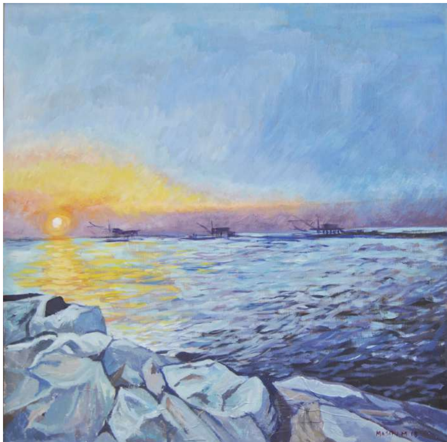
Tramonto a Marina