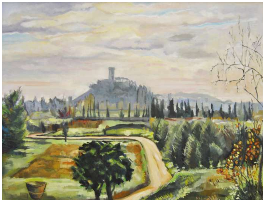
Veduta di Vicopisano visto dal frantoio