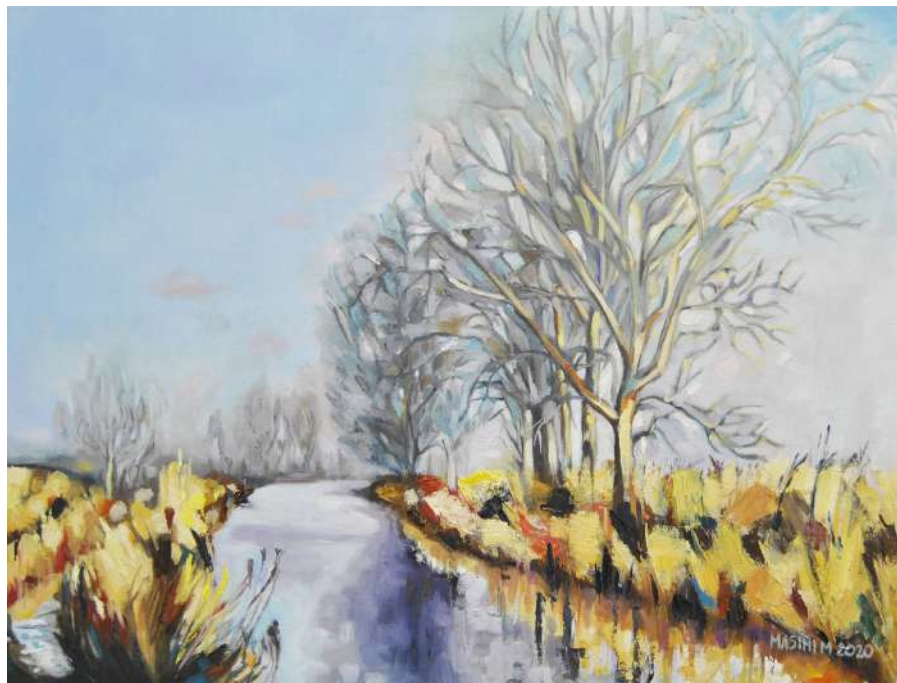
Una fredda mattina di inverno