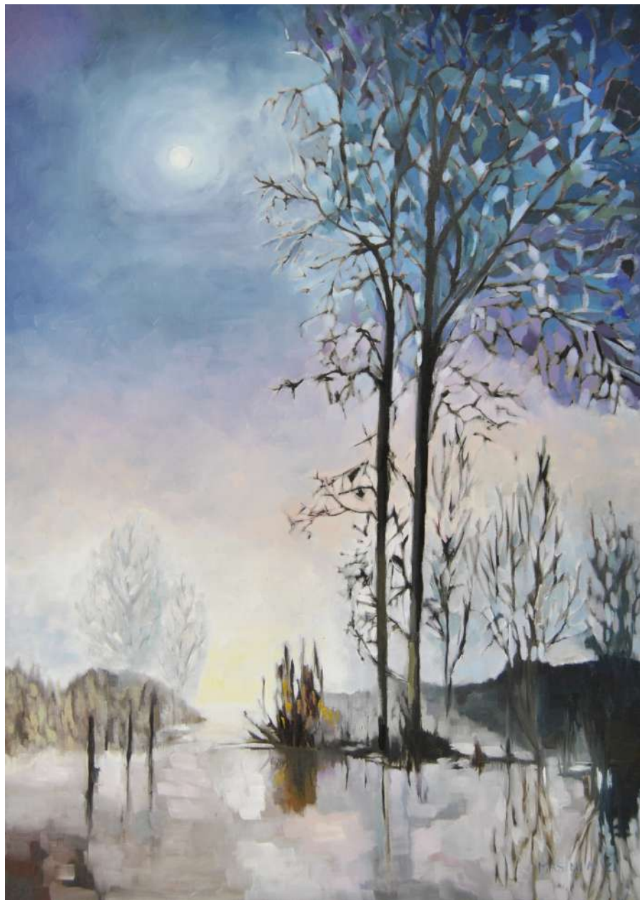
Notte di luna piena