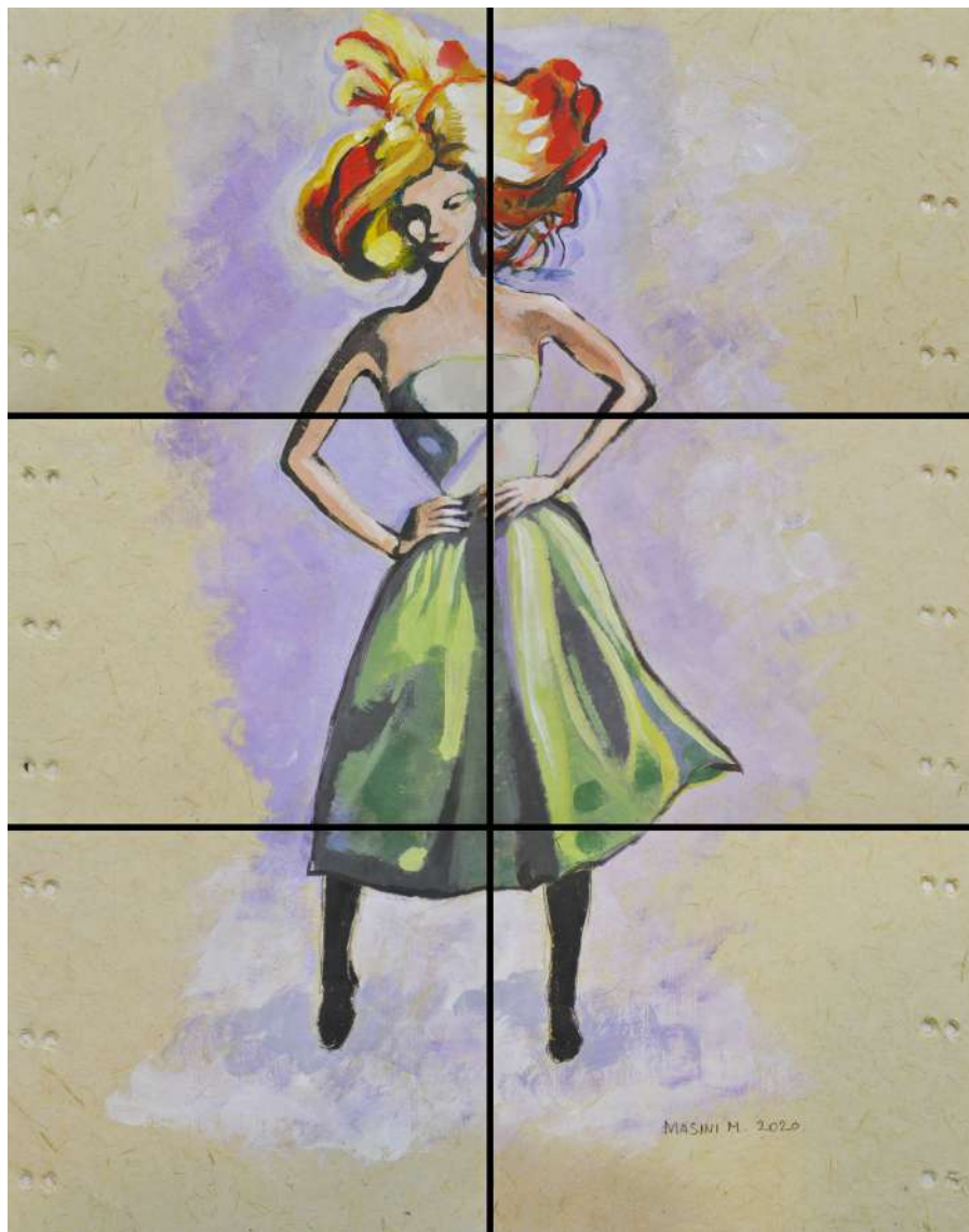
Lady testa matta