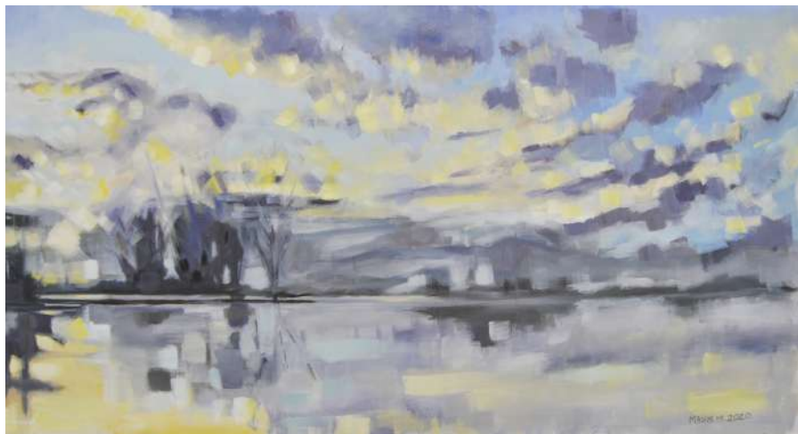
Paesaggio al tempo del Covid 19