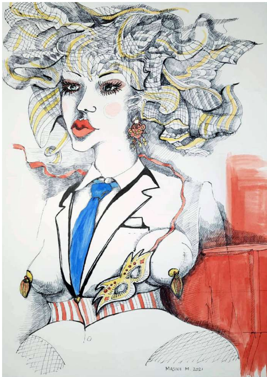
Marchettara di Palazzo