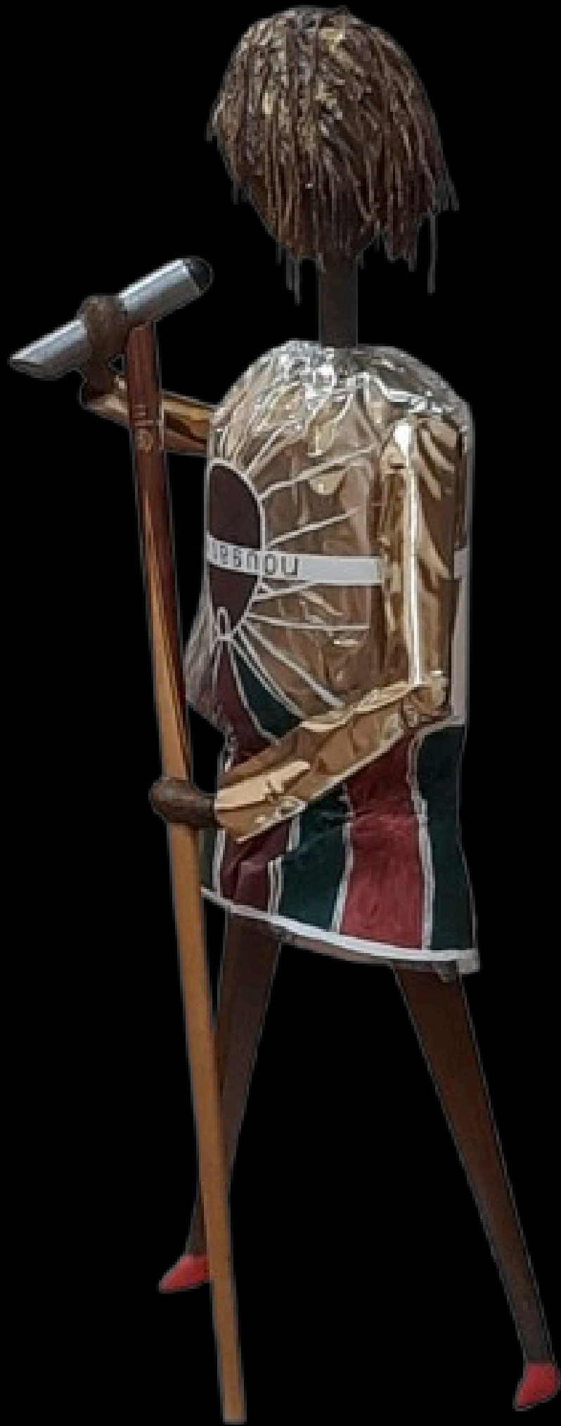
“Tina Turner nougatine ”