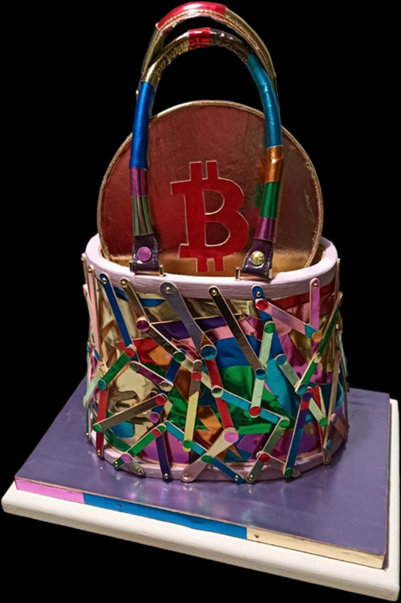
"Il Bitcoin in borsa"