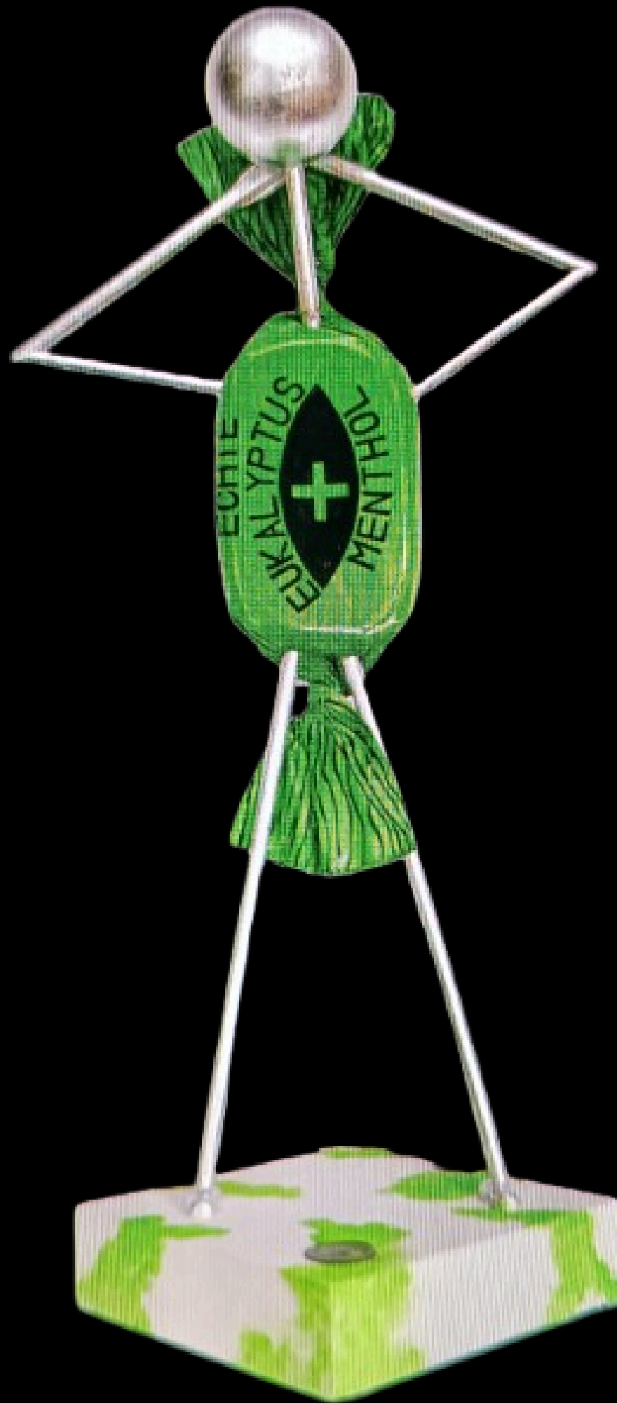
"Eukalyptus android "