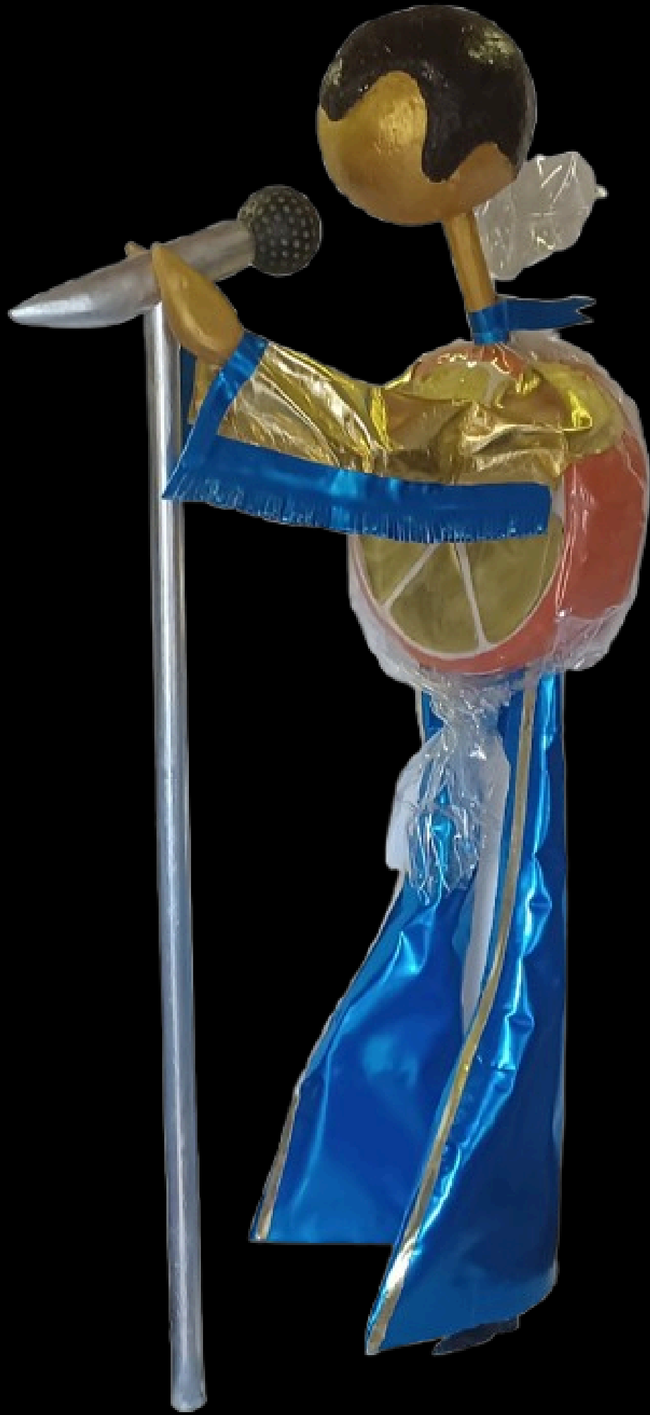
“Elvis rocks bon bon ”