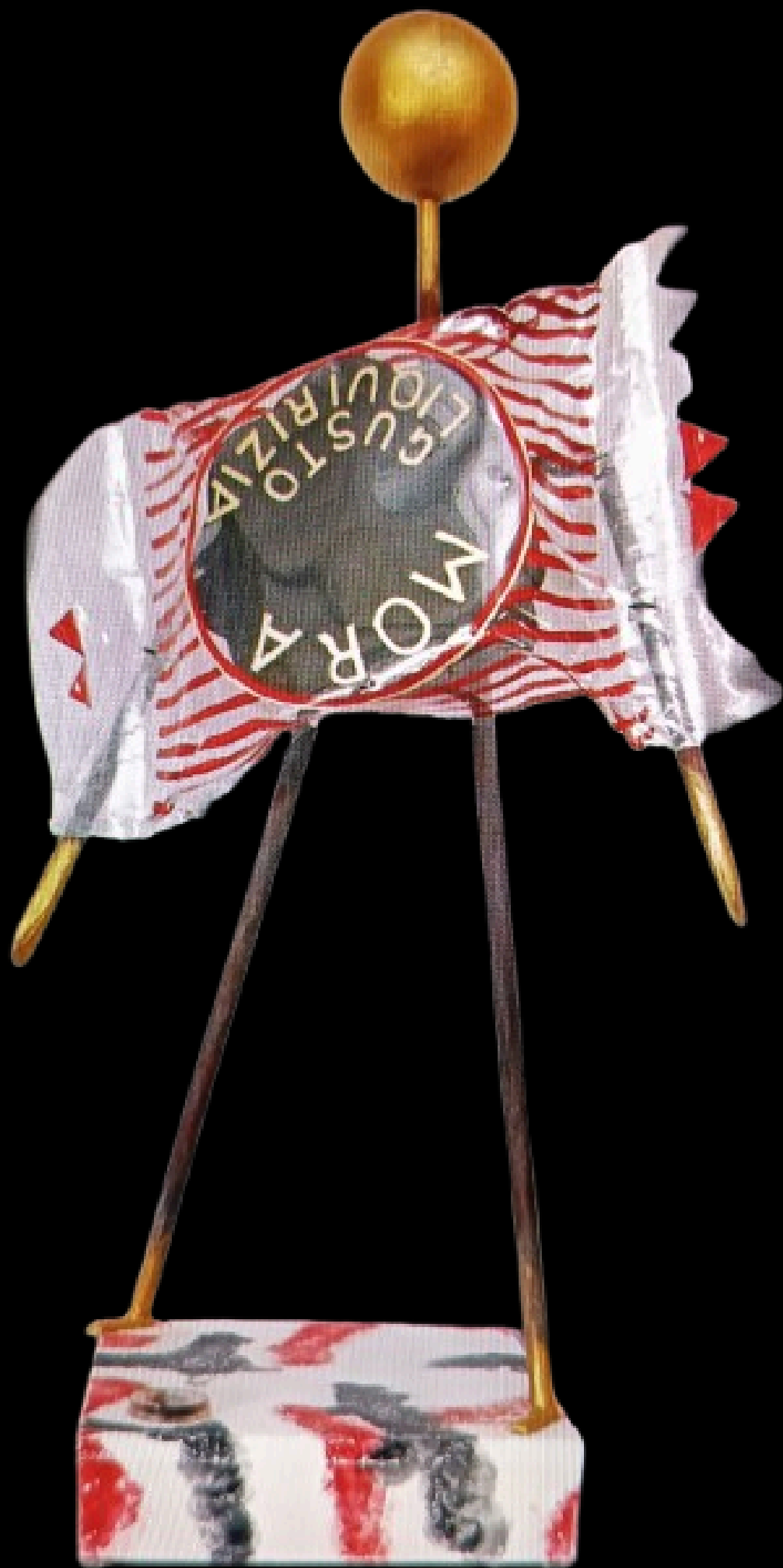
"La signora mora"