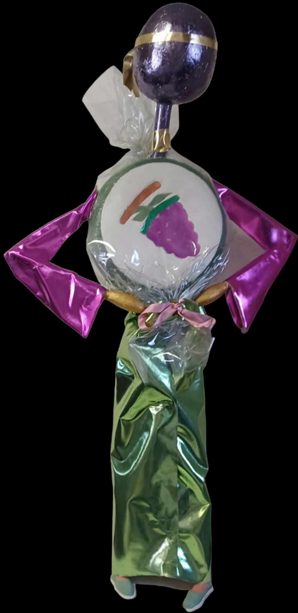
"Patty Bravo rocks bon bon"