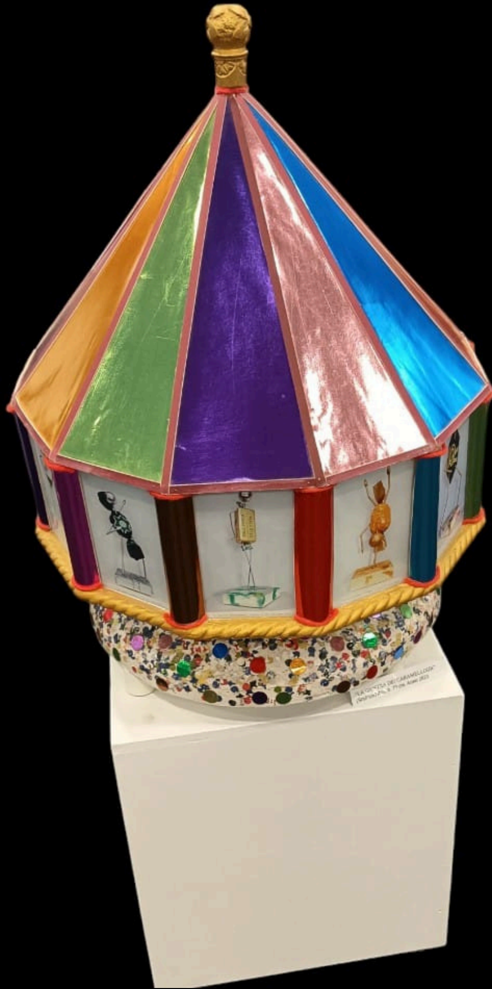
“La giostra dei caramelloidi”