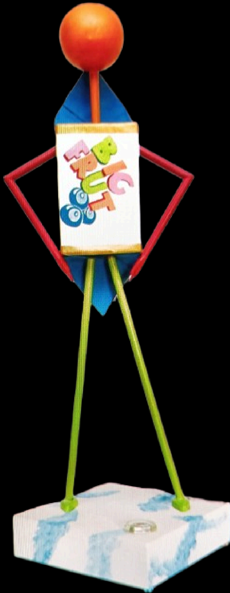
“Big Frut Android”